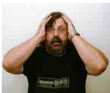
Co to ten obžalovaný kecá?

obžalovaný mluvčf: Ano, ano. Kde to jenom mám, kde to jenom (v tuto chvíli si obžalovaný sundal svetr a zpod něho vykouklo k všeobecnému zděšení jeho zrádcovské tričko galerie Tvrdohlavých).