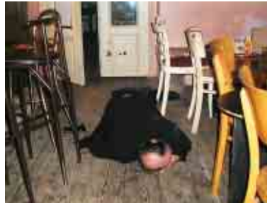
GG poslouchá zda jsou již voliči na cestě