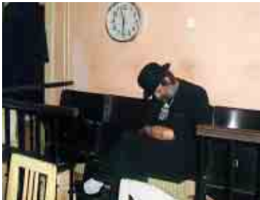
Geniální guvernér pracující