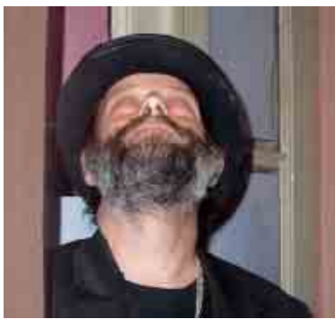
Geniální guvernér myslící