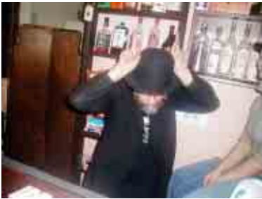
GG v rozhovoru s redaktory TV Nova