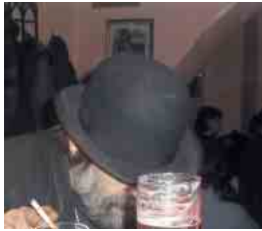
Geniální guvernér kouří