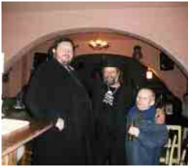
Ani malý ani velký, zkrátka akorát