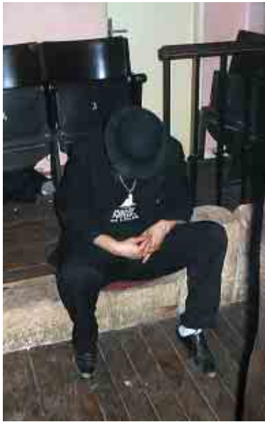
Geniální guvernér v plném soustředění