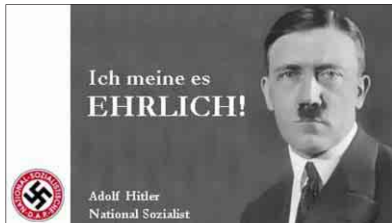
Volební plakát do říšského sněmu z roku 1932 - Myslím (míním) to upřímně

Když se tak na to musím po vlastech českých denně dívat, napadá mne, že to to musí být určitě něco magického, když donutí politika myslet upřímně. Až mne z toho mocného ta běhá mráz po zádech. A jakou fantazii v člověku vyvolává. Kolik politiků se již k tu hlásilo a vždy demonstrovali, jak jej myslí upřímně.