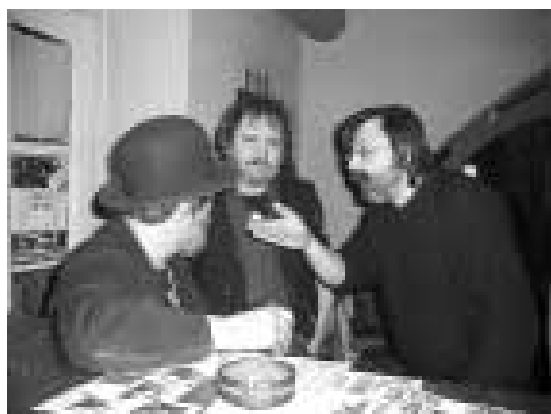
Poslední dochovalý snímek mlčícího mluvčího, tenkrát ještě v družném rozhovoru s vedením strany