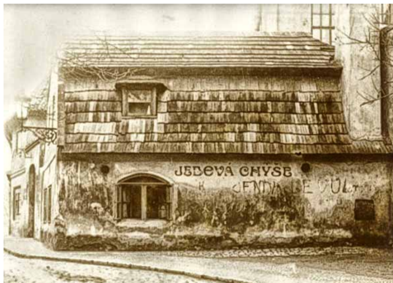
Jedová chýše kdysi a dnes