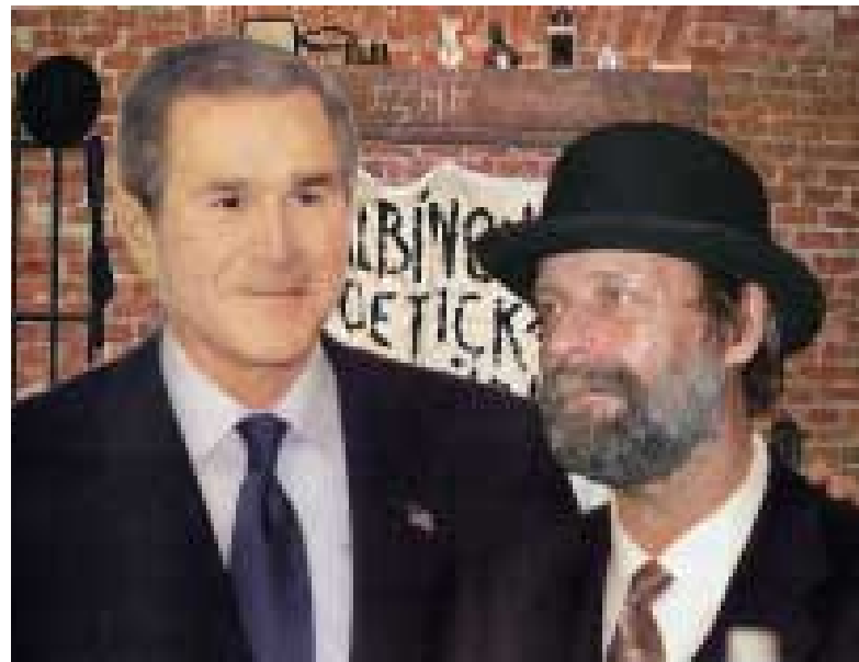
Neskrýpaná radost pana Bushe z možnosti uvyžít se s Geniálním guvernéřem