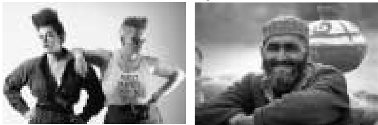
Mladé Neobalbínky Mladý Talíbalbínec