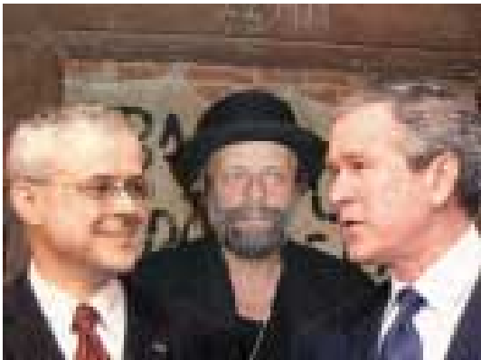
Na přání pana Busha se veškerá jednání s našimi politiky vedla pod přímým dohledem Geniálního guvernéra