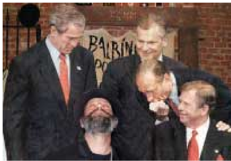
Pánové chovejte se slušně, tady nejste v Kongresovém centru.